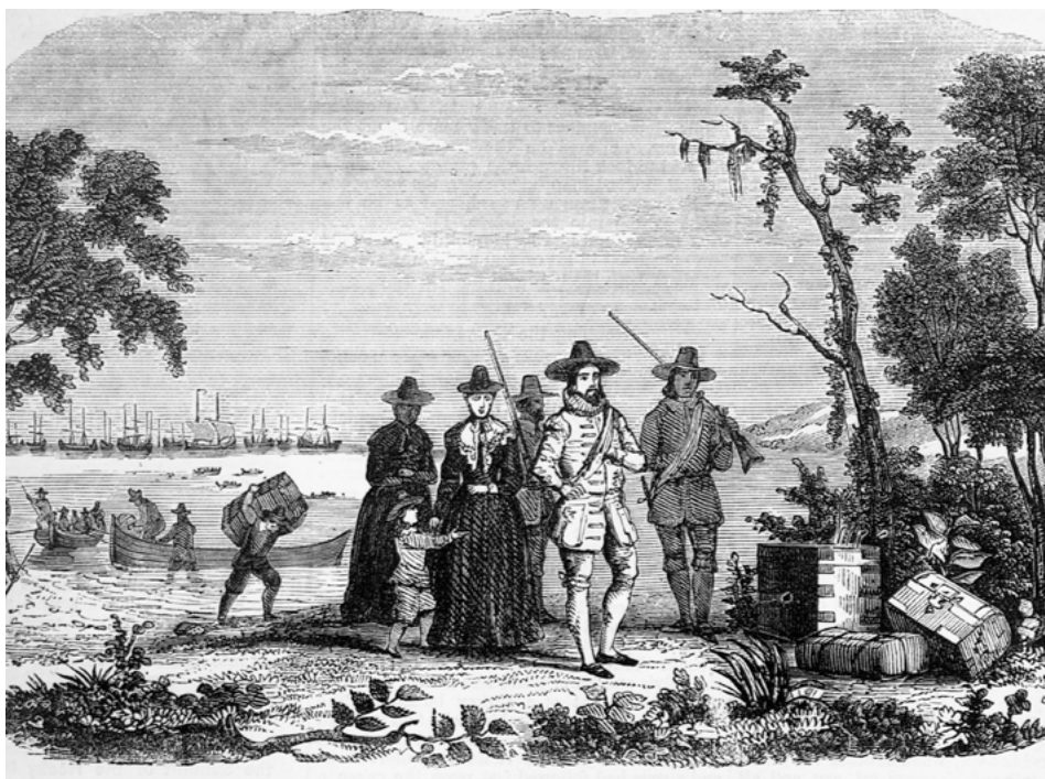
Fundació de Massachusetts Bay Colony