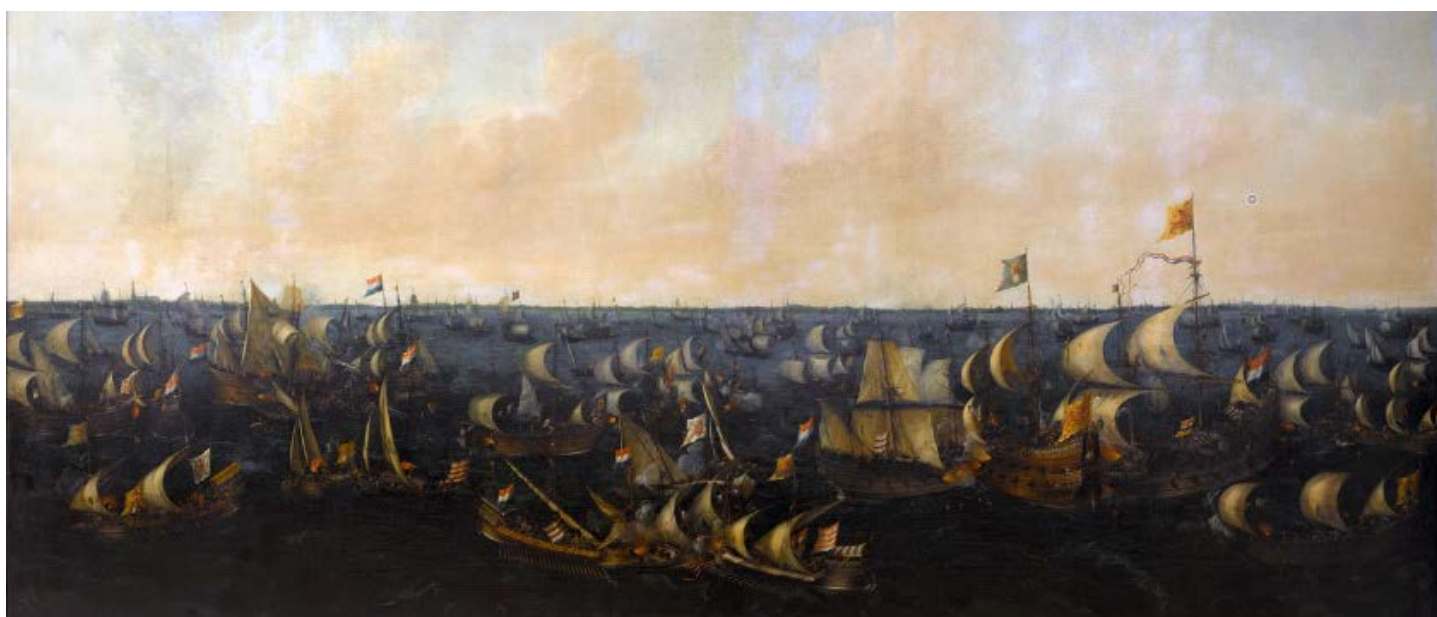
Moment de la Guerra de la Independència

logia del món, l'American Journal of Dental Science, que incorporava anotacions del president agraint als professionals dentals la preocupació per restablir les dents perdudes amb pròtesis dentals.