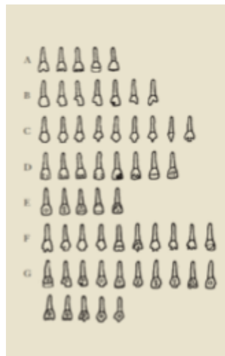
Classificació de Romero (1986). Tipus de mutilacions dentàries.

La justificació d'aquesta pràctica respon a diverses hipòtesis: ornamentació, estatus social, motivacions rituals com els ritus de passar d'infant a adolescent, de solter a casat. Se suposa que qui la portava a terme eren subjectes especialitzats en aquesta tècnica, que havien adquirit de manera empírica un domini de l'anatomia dental. Es practicava in vivo en individus joves capaços de suportar durant dies que els llimessin les dents.