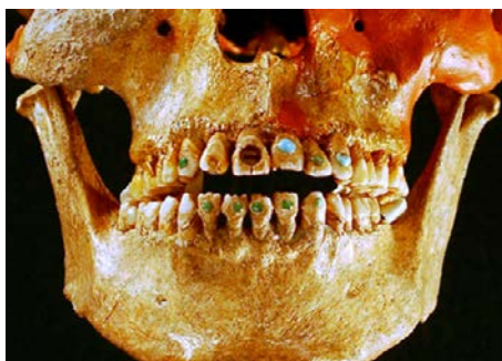
Institut Nacional d'Antropologia i Història (INAH) Yucatán

Són clàssiques les classificacions de les mutilacions dentals de Saville (1913), Rubin de la Borbolla (1944), però la classificació per excel·lència és la de Romero (1970-1986), feta després de l'estudi d'una col·lecció de 1.212 dents d'una població mesoamericana prehistòrica de l'Institut Nacional d'Antropologia de Mèxic. Romero identificà les mutilacions dentals segons la naturalesa de l'alteració del contorn coronari, la inclusió d'elements decoratius de les superfícies vestibulars o la presència de totes dues coses. Malauradament no disposem d'estudis tan rigorosos en altres pobla-