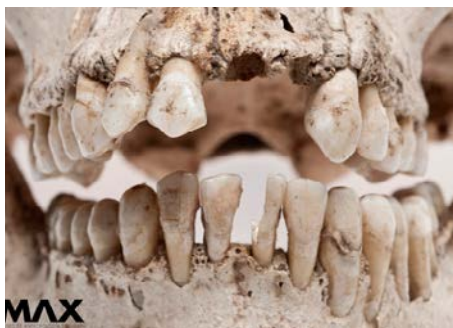
Museu d'Antropologia de Xalapa (MAX)

cions, encara que també s'han identificat restes arqueològiques amb mutilacions dentals a l'Amèrica del Nord i del Sud, l'Àfrica, l'Índia, el sud-est asiàtic, l'arxipèlag Malai, les Filipines, Nova Guinea, el Japó i Oceania; també en territoris on s'han trobat restes òssies d'esclaus africans, com Cuba, la República Dominicana o Puerto Rico. L'última classificació la van desenvolupar Alt, Rösing, Teschler-Nicola i Pichler el 1998.